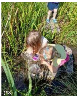
Unser Umwelthaus bietet Kindern vielfältige Möglichkeiten die Natur zu erleben – Hier bei der Veranstaltung „Auf der Suche nach Bachflohkrebsen und Wasserskorpionen“

Rechte Seite: Unser Umwelthaus mit Lerngarten am Obergrashof