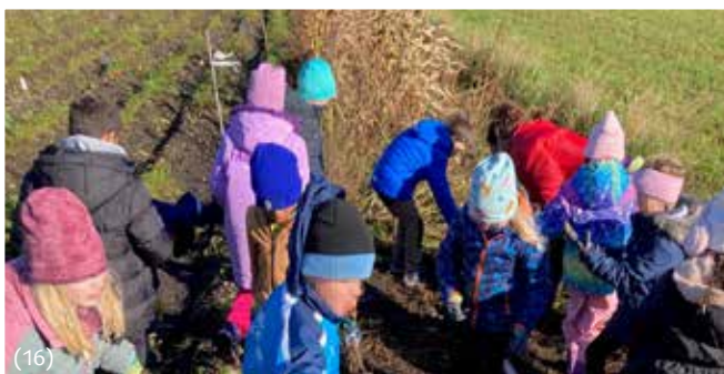
Projekttag für Grundschüler: Auf dem Schulacker am Obergrashof