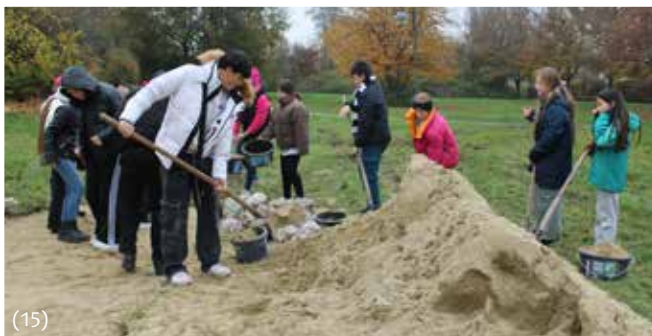
Bau einer Nisthilfe für bodenbrütende Insekten – Gemeinschaftsprojekt mit der Mittelschule und der Gemeinde Karlsfeld