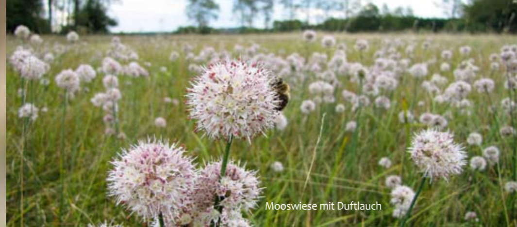
Mooswiese mit Duftlauch