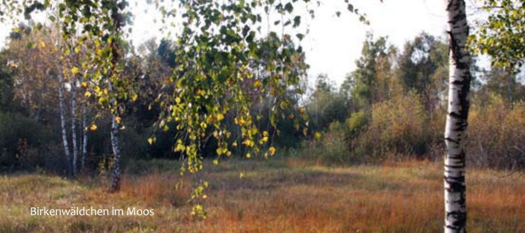
Birkenwäldchen im Moos